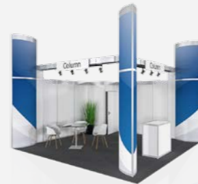
COLUMN ab 78,20 €/m 2 online konfigurierbar