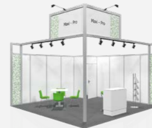
MAXI PRO ab 78,20 €/m 2 online konfigurierbar