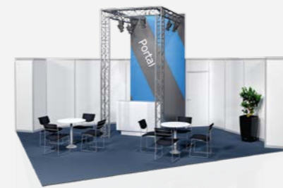
PORTAL ab 105,90 €/m 2 online konfigurierbar