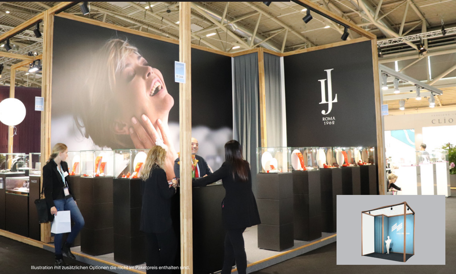
Illustration mit zusätzlichen Optionen die nicht im Paketpreis enthalten sind.