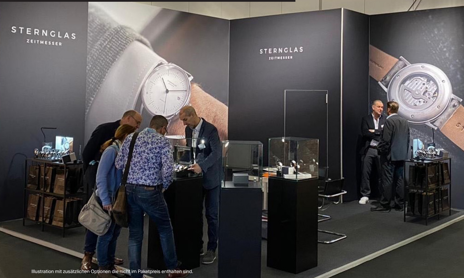
Illustration mit zusätzlichen Optionen die nicht im Paketpreis enthalten sind.