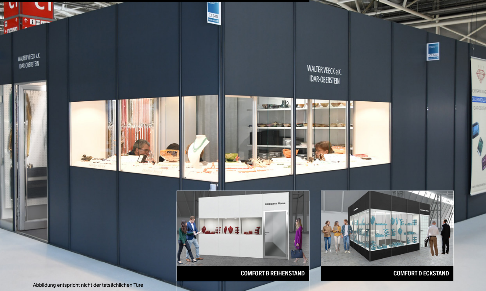
Abbildung entspricht nicht der tatsächlichen Türe