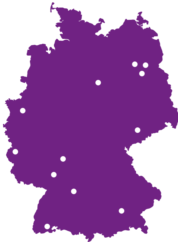
12 Standorte in Deutschland