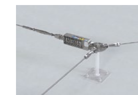
LUX-top® FSE 2003 VERTEILERSCHEIBE