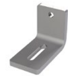
LUX-top® FSA 2010 - H HALTER L-80