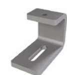
LUX-top® FSA 2010 - H HALTER C-FORM