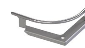
LUX-top® FSE 2003 SEILFÜHRUNG 90°