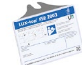
LUX-top® FSE 2003 HINWEISSCHILD

* mit Ausgleichsfeder für kontinuierliche Seilvorspannung bei temperaturbedingten Längenänderungen und als schockabsorbierendes Element zur Kraftreduzierung.