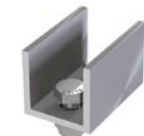
LUX-top® FSA 2010 - H ENDSTÜCK U-FORM