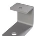
LUX-top® FSA 2010 - H HALTER ASP