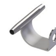
LUX-top® FSE 2003 SEILFÜHRUNG WAND- & DECKEN- MONTAGE TYP SZH-W