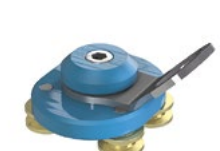
LUX-top® FSA 2010 - H SCHIENENLÄUFER TYP HSL45