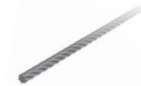
LUX-top® FSE 2003 EDELSTAHLSEIL 8 mm