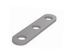
LUX-top® FSE 2003 STOSSVERBINDER