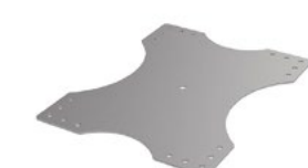
LUX-top® FSA 2010 - H HALTER TRAPEZPROFIL