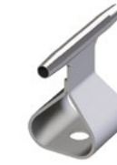
LUX-top® FSE 2003 SEILFÜHRUNG GERADE TYP SZH-Z