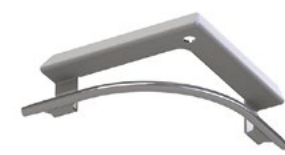
LUX-top® FSE 2003 SEILFÜHRUNG 90° -O AUSSENECKE