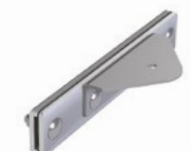
LUX-top® FSA 2010 - H HALTER DOPPELSTEHFALZ