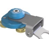
LUX-top® FSA 2010 - H SCHIENENLÄUFER TYP HSL ÜBERKOPF