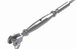
LUX-top® FSE 2003 SPANNELEMENT