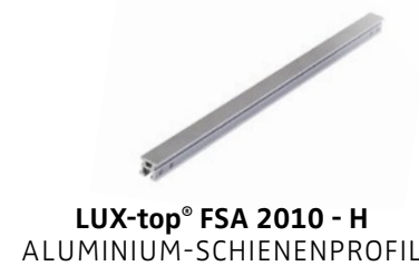
LUX-top® FSA 2010 - H ALUMINIUM-SCHIENENPROFIL