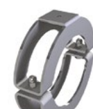
LUX-top® FSA 2010 - H HALTER ROHRSCHELLE