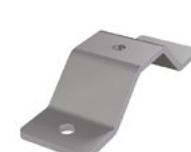
LUX-top® FSA 2010 - H HALTER OMEGA