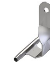
LUX-top® FSE 2003 SEILFÜHRUNG OBEN SZH-O