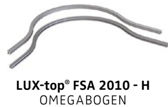
LUX-top® FSA 2010 - H OMEGABOGEN