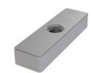
LUX-top® FSA 2010 - H RECHTECK-KLEMMMUTTER M10