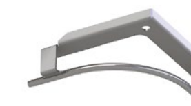
LUX-top® FSE 2003 SEILFÜHRUNG 90° -O INNENECKE