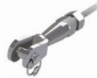
LUX-top® FSE 2003 ENDTERMINAL