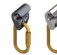
LUX-top® FSE 2003 SG-A/SG SEILGLEITER IN ALUMINIUM ODER EDELSTAHL