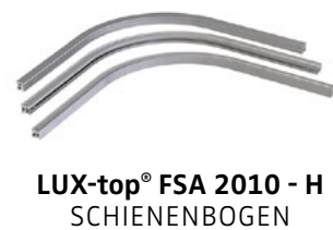
LUX-top® FSA 2010 - H SCHIENENBOGEN