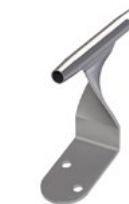
LUX-top® FSE 2003 Distanzhalter