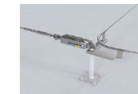
LUX-top® FSE 2003 SEILFÜHRUNG 90° & SKE II