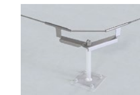
LUX-top® FSE 2003 SEILFÜHRUNG VARIABEL