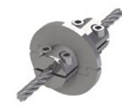
LUX-top® FSE 2003 STOP