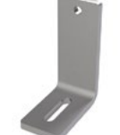
LUX-top® FSA 2010 - H HALTER L-150