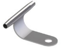
LUX-top® FSE 2003 SEILFÜHRUNG EINSEITIG TYP SZH-E