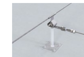
LUX-top® FSE 2003 SEILFÜHRUNG GERADE & STOSSVERBINDER