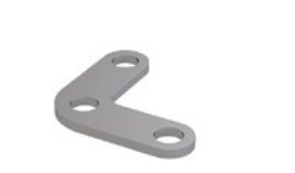
LUX-top® FSE 2003 ECKVERBINDER