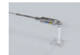
LUX-top® FSE 2003 SPANNELEMENT