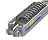
LUX-top® FSE 2003 SKE II SEILKRAFTERHALTER*