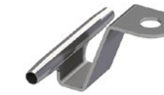
LUX-top® FSE 2003 SEILFÜHRUNG UNTEN TYP SZH-U