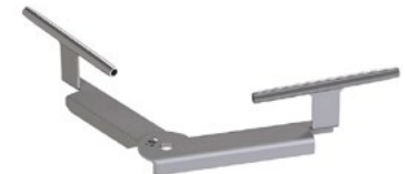
LUX-top® FSE 2003 SEILFÜHRUNG VARIABEL