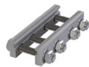
LUX-top® FSA 2010 - H STOSSVERBINDER LA