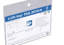
LUX-top® FSA 2010 - H HINWEISSCHILD A2