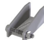
LUX-top® FSA 2010 - H KLAPPBARER AUSSENANSCHLAG