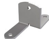
LUX-top® FSA 2010 - H HALTER L-80 WDVS