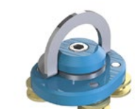
LUX-top® FSA 2010 - H SCHIENENLÄUFER TYP HSL90