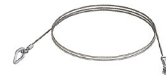
LUX-top® AR ZUGANGSSEIL